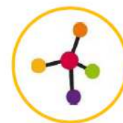
Scienze della vita